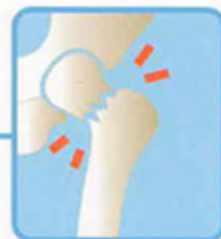
足の付け根 (大腿骨近位部)