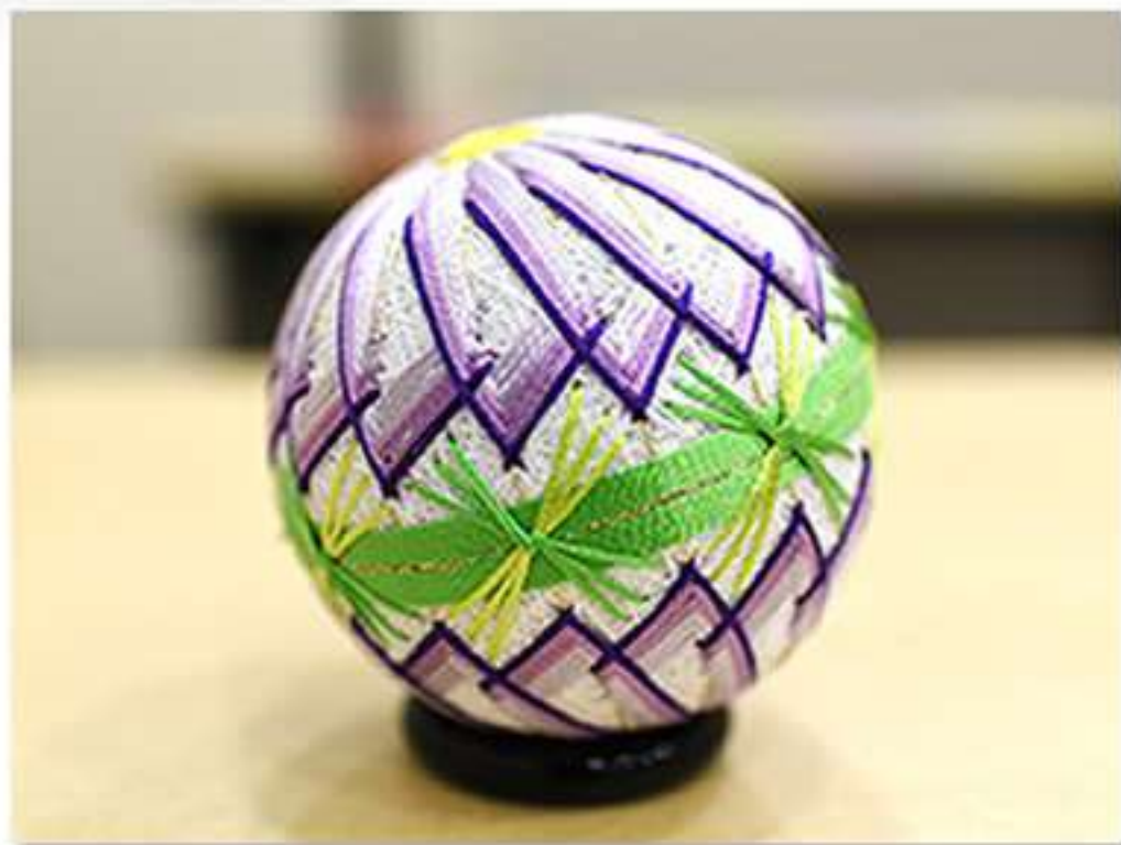
女性（京都府・74歳） 関節リウマチ