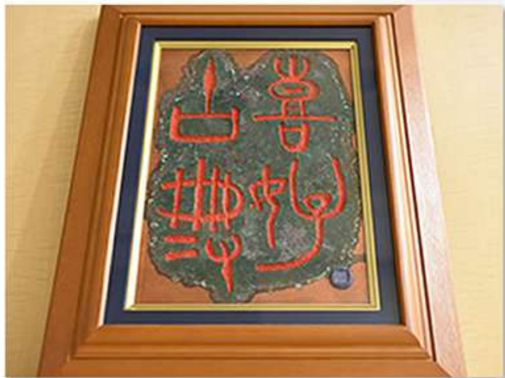
男性（京都府・67歳） 尋常性乾癬